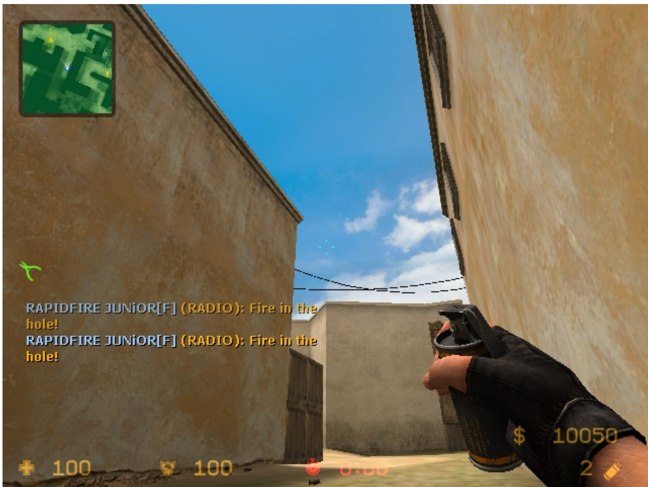
センターからAに喰らわせるFBその2。見えない壁に反射させよう。