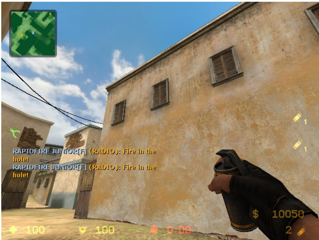
センターからAに喰らわせるFBその1。走って投げよう。