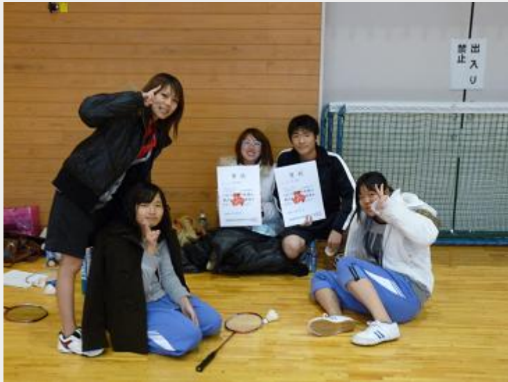
H21 女子バドミントン部 全国・東海大会出場 H21 男子バドミントン部 全国・東海大会出場